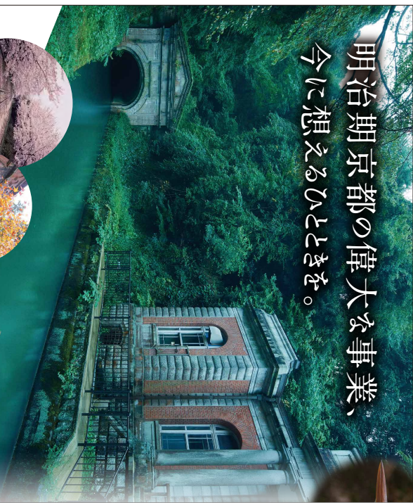
第三トシムル口(旧清水園)の噴水