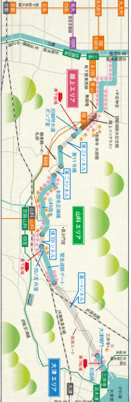
遊覧MAP このMAPは、琵琶湖疎水の遊覧ルートを示しています。