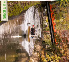
本町寺正満橋 川段を流す水が、滝の水に響かれます。