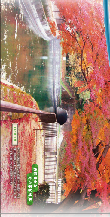
この公園の周辺には、自然豊かな外の新緑地帯が広がっています。自然豊かな外の新緑地帯が広がっています。