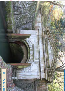
第一トシムル入口 この入口は、明治の偉業を築いた堂々たる花博覧の洞門です。