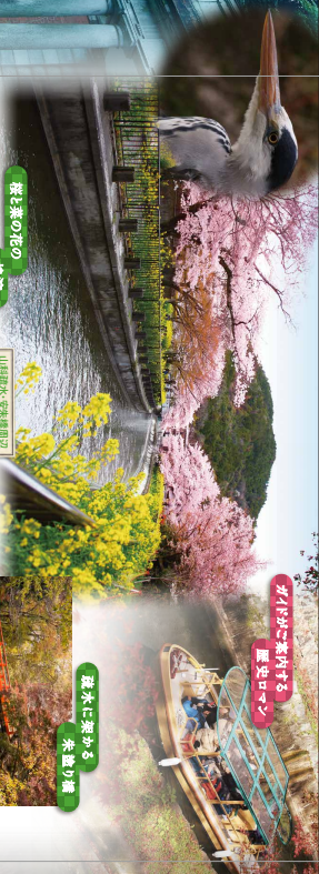
桜と春の花の雄渡