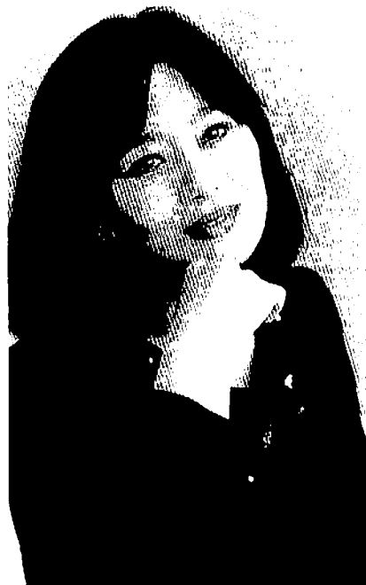
若林 暢 Nobu Wakabayashi ヴァイオリン Violin

彼女はエレガントなヴァイオリニストだ。音にはふくらみがあり、音量も豊かで、しかも美しい。・・・その解釈は情緒に満ち、忠実で、細部にわたって綿密に磨き抜かれている。